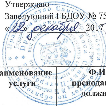
График предоставления дополнительных образовательных услуг на платной основе в ГБДОУ № 75 Приморского района на 2017 – 2018 уч. г.